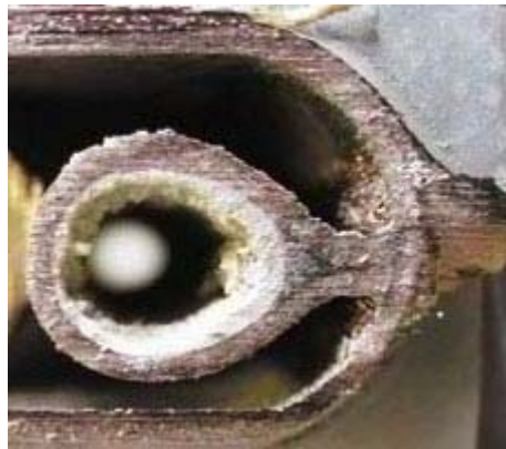
Querschnitt durch einen verkalkten Heizkessel

Die Aufbereitung des Füll- und Ergänzungswassers für WW-Heizungsanlagen werden gem. VDI-Richtlinie 2035 von 1996 und Wasseraufbereitung für Heißwasser- und Warmwasserheizungsanlagen gem. VdTÜV-Richtlinie TCh 1466 bez. AGFW 5/15 festgelegt. Maßgebend für die Wasseraufbereitung sind die entsprechenden Richtlinien. Bei richtiger Anwendung, Interpretation und Ausführung gewährleisten sie die Korrosionssicherheit und Steinverhütung.